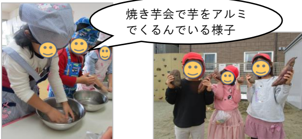
焼き芋会で芋をアルミでくるんでいる様子

10月にわかば農園で収穫したさつまいもは、みそ汁の具や、焼き芋会での焼き芋、さくら組リクエストの大学芋などで、存分に味わいました。